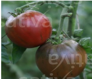
Auslese Noire de Crimée

Frühreifend, indeterminant, runde, platzfeste Fleischtomate mit sehr gutem Geschmack und wenig Fruchtsäure. Alte Sorte. Geschützter Anbau empfohlen.