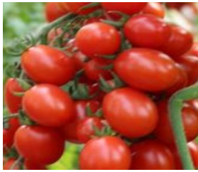
Miri Miri (RS)

Mittelfrüh, indeterminant, dichte Rispen mit enorm vielen kleinen roten oval-runden Früchten, ausgezeichnetes süß-fruchtiges Aroma, platzfest, für Freiland und geschützten Anbau geeignet