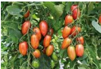
Artisan Pink Tiger

Mittelfrüh, indeterminant, wüchsig und produktiv. Spitz zulaufende, rot-gold geflammte, knackige Früchte mit kräftig-süßem Geschmack. Für Freiland und geschützten Anbau geeignet